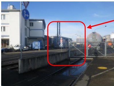
Sicht auf das Geleis der Hafeneisenbahn

Basierend auf einem Beinaheunfall wurde die Sicht auf das Geleise bereits bedeutend verbessert: